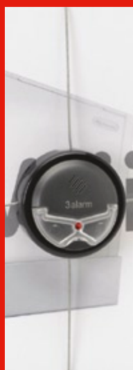
Soluciones para niveles de hurto elevados