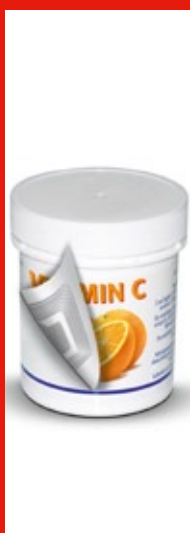
Etiquetado en origen