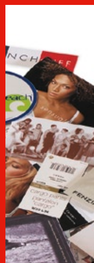
Soluciones de etiquetado para el mercado textil