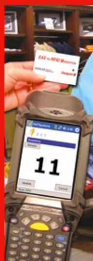
Visibilidad de la mercancía