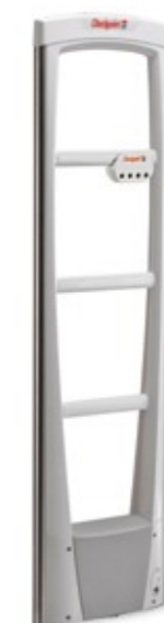
Antena EVOLVE P10 con unidad integrada EVOLVE VisiPlus™

EVOLVE significa evolución. Como su nombre indica, nuestra gama EVOLVE ha sido diseñada para evolucionar con el negocio del minorista. Desde el principio, esta gama se ha concebido como una plataforma abierta capaz de incorporar fácilmente nuevas funciones como RFID, redes avanzadas y detección de bolsas de aluminio y de integrarse sin problemas con otros sistemas de prevención de pérdidas.